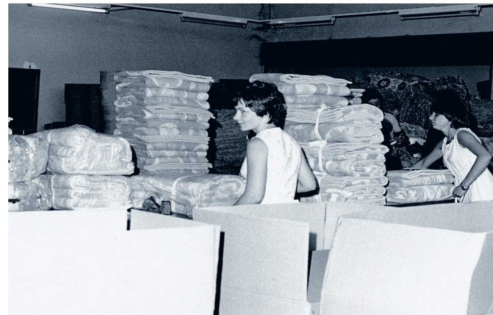
Reparto di Tessiture Pietro Radici, azienda attiva nella produzione di coperte, Leffe, anni '50

Quattro anni dopo è la volta della coperta Angora: a ottobre del 1954 la diffida viene pubblicata sul giornale per tre giorni di seguito, anche su più pagine della stessa edizione. "Alcuni nostri clienti - recita - ci informano che qualche fabbrica concorrente ha messo in vendita, specialmente nella Germania occidentale, un tipo di coperta che imita il nome e la confezione della nostra marca Angora deposita-