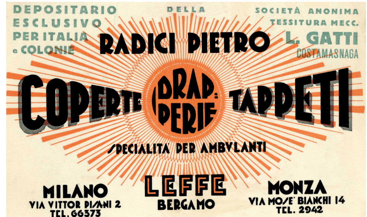
Cartellone pubblicitario anni '50