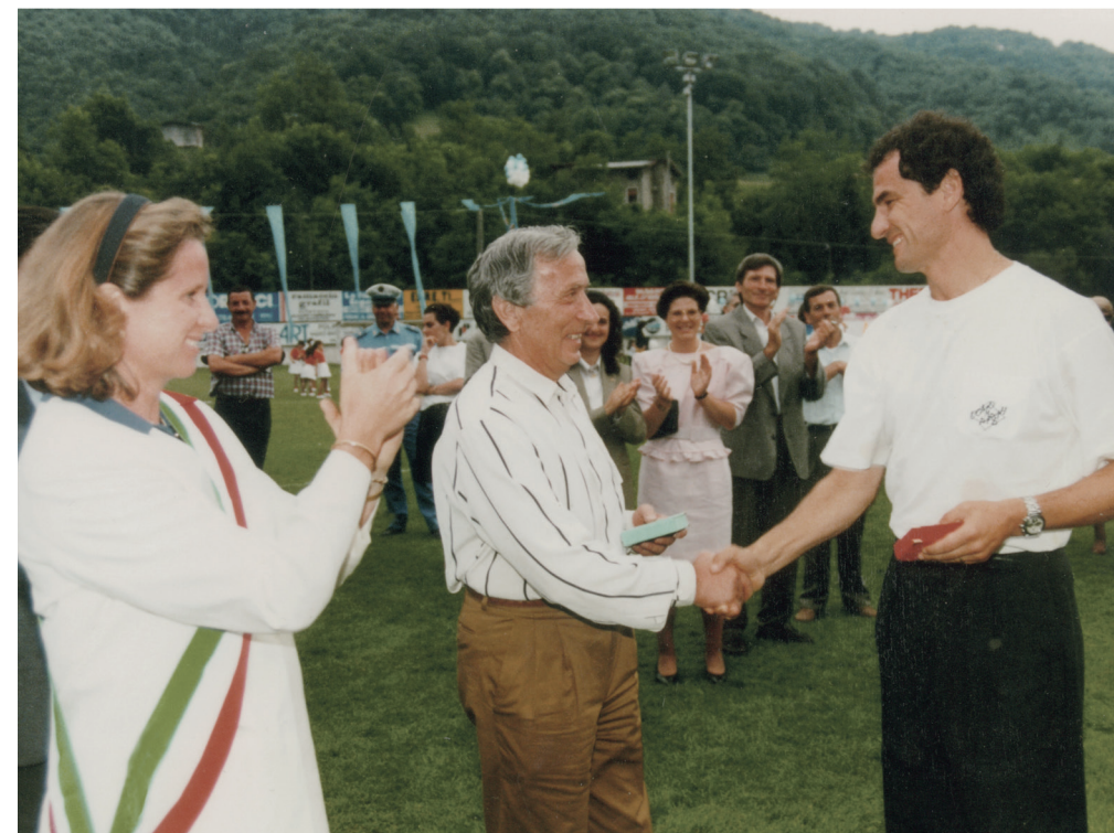
Calcio Leffe, promozione in C2, 1985