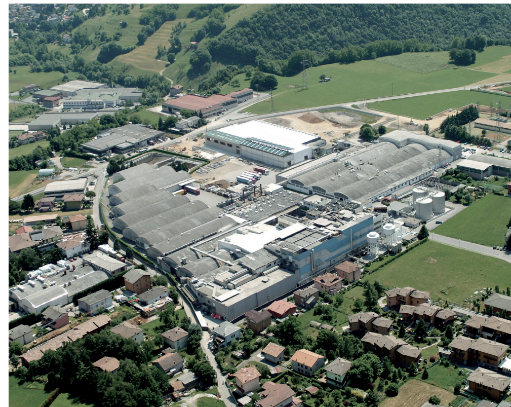
Visione aerea dello stabilimento RadiciFil a Casnigo