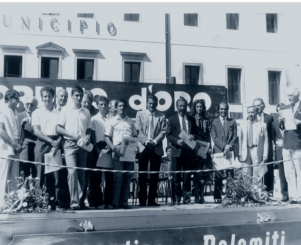
IV Agordino d'Oro, 1985

Per l'energia e la lungimiranza con cui è riuscito a sviluppare un'attività industriale differenziata prima nella sua amata Val Seriana e successivamente in Belgio, Germania, Svizzera