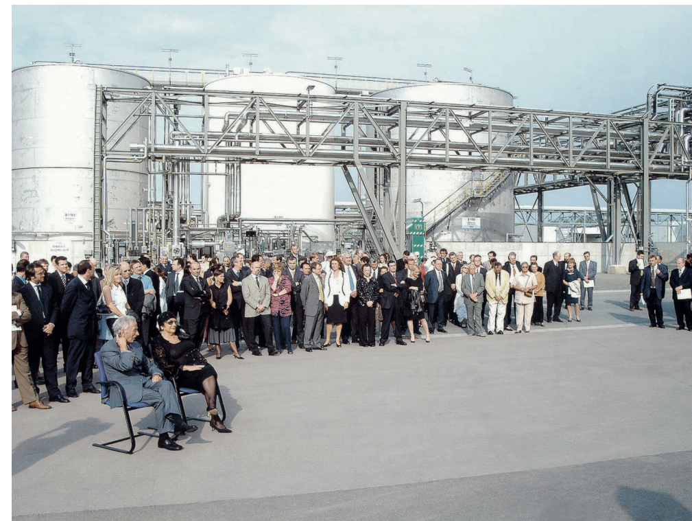
Inaugurazione Radici Chimica Deutschland, 2001

Da Lefte, da un mondo fatto di lana e di coperte, al cuore della grande chimica