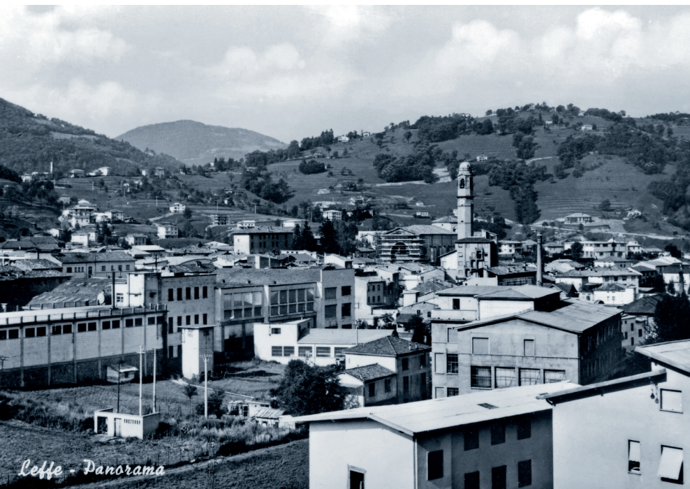
Panorama di Leffe