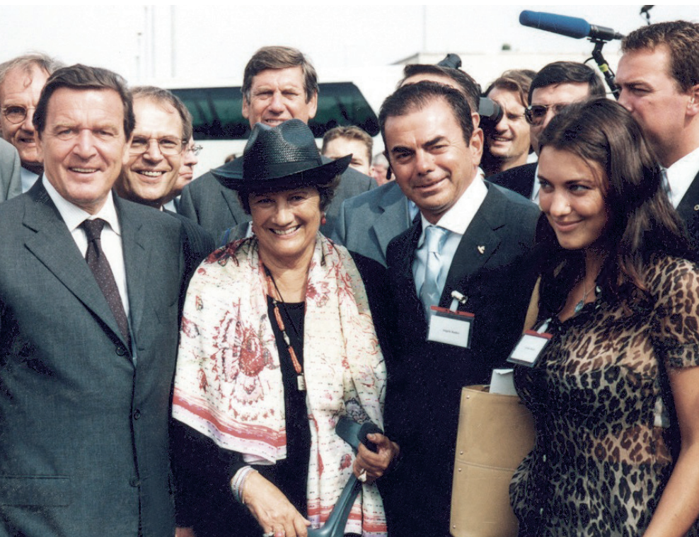
Inaugurazione Radici Chimica Deutschland 2001, a sinistra il cancelliere tedesco Gerhard Schröder

Da Lefte, da un mondo fatto di lana e di coperte, al cuore della grande chimica