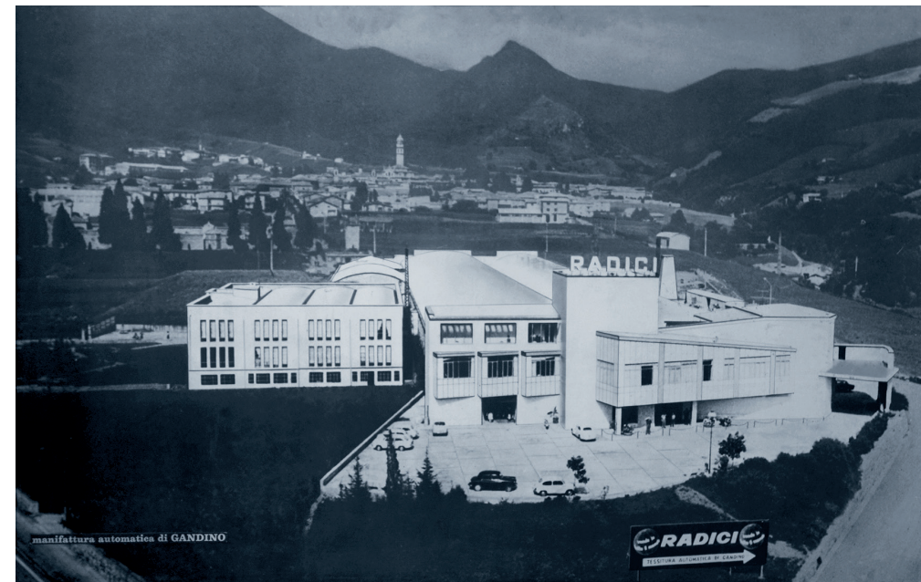
Manifattura Automatica a Gandino, anni '60