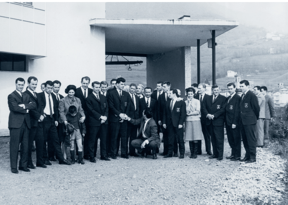
Giocatori del Borussia Dortmund in visita a Gandino, 1964